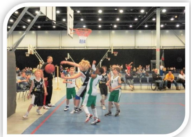
Orissaare Rocki P 99meeskond mängimas Lahtis Easter Tournament 23. aprillil

Käesoleval hooajal osaletakse Lääne korvpalliliigas, mille mängud toimuvad Haapsalus ja Orissaares.