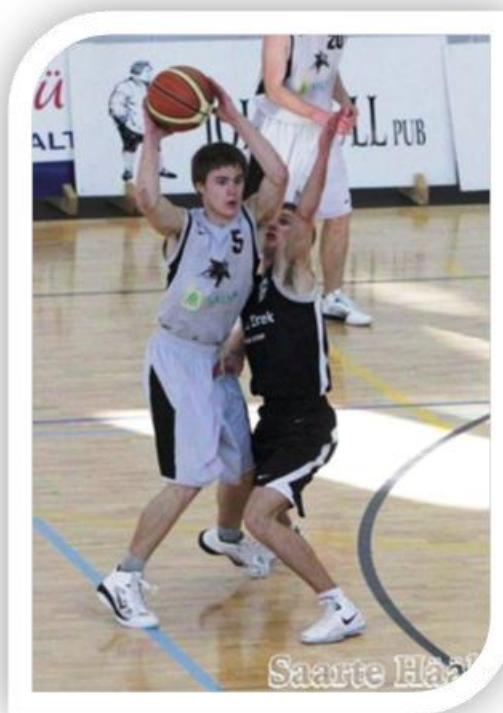
Härmo Lambut Saaremaa 2010/2011 MV väärtuslikuma mängija auhind