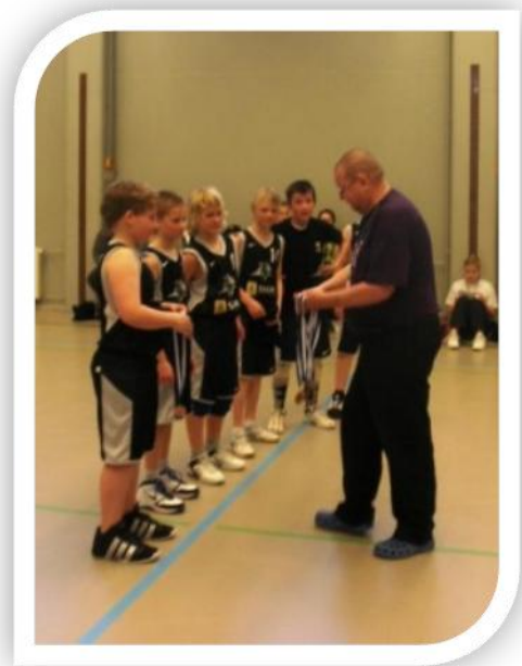
Orissaare Rocki P99 võistkond autasustamisel Lahtis Lihavõtteturniiril 24. aprillil